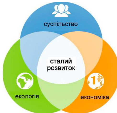
Рис. 1. Основні складові сталого розвитку

Сталий розвиток – це концепція, що закликає до гармонійного балансу між економічним зростанням, соціальною стабільністю та збереженням довкілля (рис. 1). Вона виникла як відповідь на глобальні виклики, зокрема виснаження природних ресурсів, соціальну нерівність і екологічні кризи, які стали наслідком неконтрольованого розвитку людства. Ця ідея спрямована на те, щоб забезпечити добробут нинішнього покоління, не ставлячи під загрозу здатність майбутніх поколінь задовольняти свої потреби.