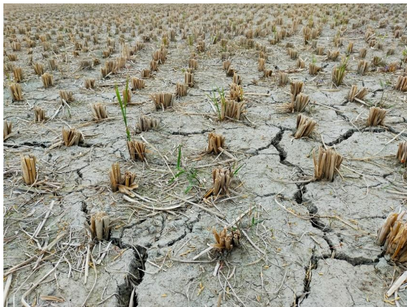
Рис. 3. Наслідки деградації ґрунту

Деградація ґрунтів є однією з найгостріших екологічних проблем у країнах Європейського Союзу, що має значні наслідки для навколишнього середовища, економіки та добробуту суспільства. Ґрунт відіграє ключову роль у підтримці біорізноманіття, водного балансу, регуляції клімату та забезпеченні продовольчої безпеки. Однак людська діяльність, зокрема інтенсивне землеробство, урбанізація та індустріалізація, спричиняє його деградацію (рис. 3), що загрожує цим важливим функціям. Проблема деградації ґрунтів залишається актуальною протягом багатьох століть. Вона є серйозним викликом, що спричиняє зростання бідності, безробіття, вимушену міграцію та міжнаціональні конфлікти. Крім того, екстремальні погодні явища, обумовлені змінами клімату, роблять землеробство ще більш ризикованим.