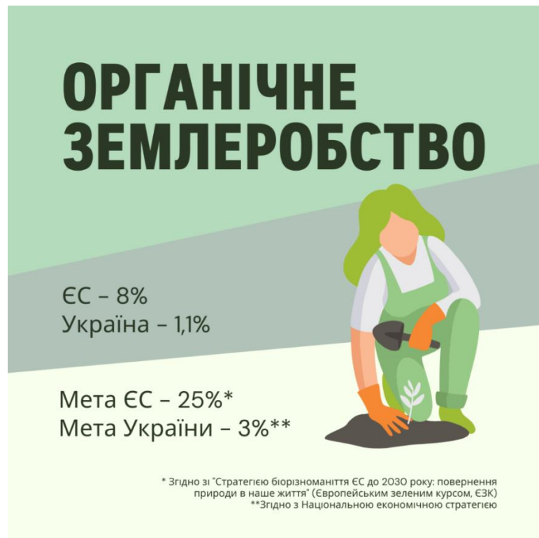
Рис. 4. Органічне землеробство в Україні та ЄС

У Європейському Союзі сталий підхід до землекористування ґрунтується на інтеграції екологічних вимог у всі аспекти сільськогосподарської діяльності. Політика спільного сільського господарства ЄС передбачає значне фінансування програм, спрямованих на зменшення впливу сільського господарства на довкілля. Ці програми стимулюють використання органічних методів землеробства, впровадження технологій точного землеробства, збереження біорізноманіття та відновлення деградованих земель (рис. 4). Окрім цього, значну увагу приділяють збереженню водних ресурсів, контролю ерозії та скороченню викидів парникових газів.