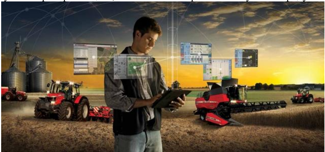
Рис. 7. Використання технологій точного землеробства

Одним із головних напрямів боротьби зі втратами є підвищення ефективності агровиробництва. Використання інноваційних технологій, таких як системи точного землеробства, дозволяє мінімізувати втрати під час збору врожаю та його зберігання (рис. 7). Цифрові інструменти допомагають фермерам краще планувати виробництво, орієнтуючись на реальний попит і зменшуючи перевиробництво, яке часто стає причиною псування продуктів.