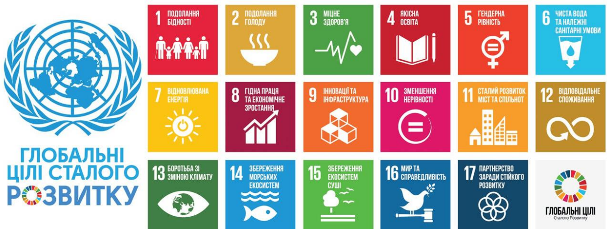
Рис. 2. Глобальні цілі сталого розвитку

Ретроспектива формування ідеї сталого розвитку демонструє, як поступове усвідомлення людством наслідків своєї діяльності привело до переосмислення підходів до розвитку. Вона об'єднує прагнення до справедливості, гармонії з природою та довгострокової відповідальності, створюючи основу для майбутнього, у якому процвітання людства та планети є взаємопов'язаними цілями.